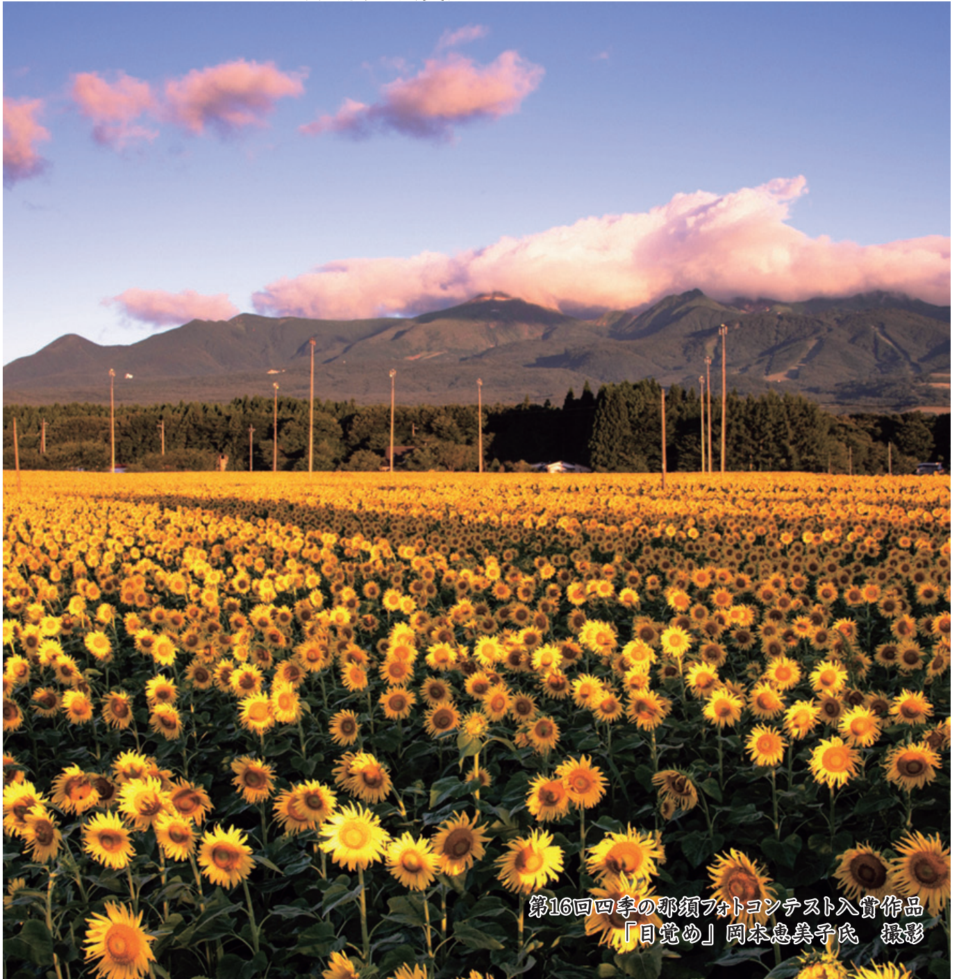
第16回四季の那須フォトコンテスト入賞作品 「目覚め」

<雄大な那須連山と一面に広がる100万本のひまわりはきっと見る人の心に響くことでしょう> 撮影者コメント：朝日を浴びた、たくさんのひまわりが、まるで太陽の分身の様に、すがすがしく目覚めた様子を撮影しました。