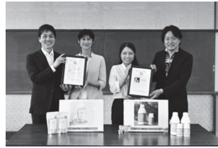
新たに認定された、ジャージー飲むヨーグルトプレーンとINAPON(イナボン)

那須町経済四団体推進連絡協議会の第13回那須ブランド認定は、更新認定が6点あり、新たに那須興業（株）ジャージー飲むヨーグルトプレーンとTINTS（株）INAPON(イナボン)の2点が認定され、認定総数は52点となりました。道の駅那須高原友愛の森「ふるさと物産センター」でも購入できます。また、那須ブランドのホームページがリニューアルされ、パンフレットの配布等を通じて今後もブランド力から町外へ那須の魅力を広げていけるよう支援していきます。