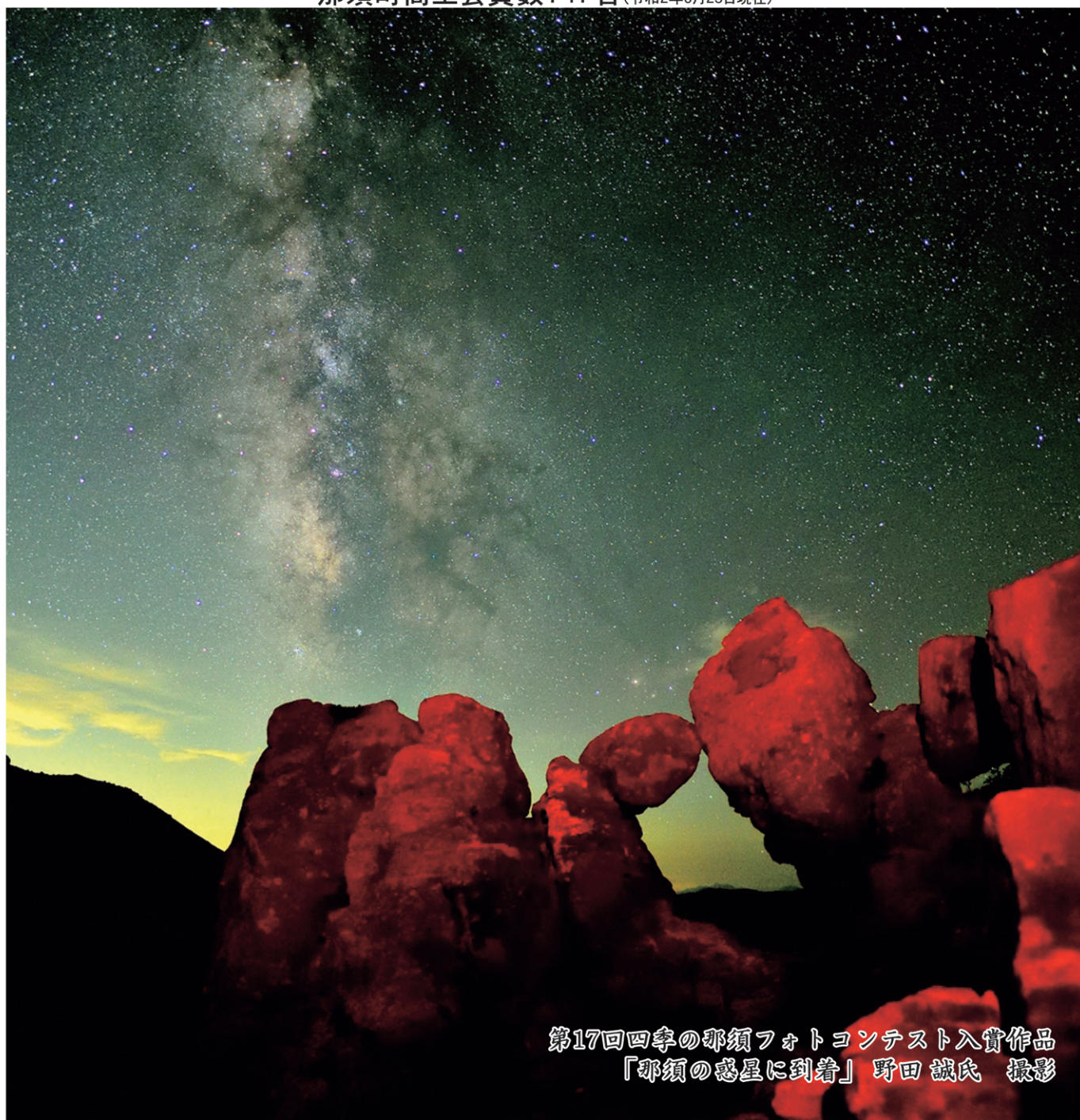
第17回四季の那須フォトコンテスト入賞作品 「那須の惑星に到着」野田 誠氏 撮影

朝日岳の登山道で最も奇岩の多いエリア。 夏の夜の天の川と奇岩に赤色光を加えたファンタジーな世界が広がりました。 <夏の天の川は、他の時期の天の川と比べると輝いて見えるそうです。>