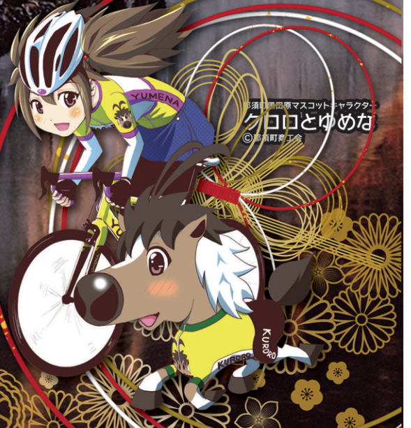
那須町商工会マスコットキャラクター ケコロとゆめな © 那須町商工会

四季の那須フォトコンテスト入賞作品 「厳寒の川」場所 芦野 小林正行 氏 厳寒の朝、川の岸に岩からしみ出た水が成長して大きなつららとなり、思った通りのつららに出あい、日の出を待ってシャッターを切りました。