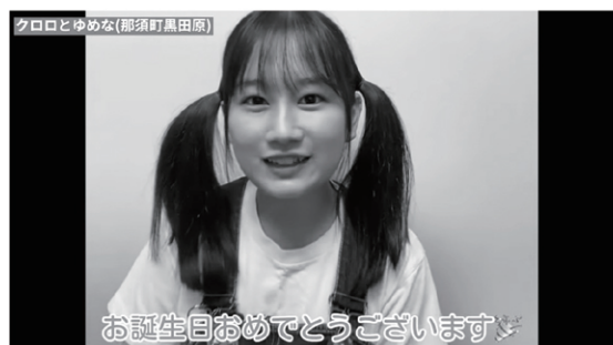
「とちまるくんお誕生日Week2021」4日目

11月8日～12日の期間「とちまるくんお誕生日Week2021」と題して、YouTube配信にて栃木県内のゆるキャラたちからのお祝い動画が配信され、ゆめなが4日目に参加しました。引き続き那須町内及び黒田原地区の良さを広く発信して参りますので事業協力をよろしくお願いいたします。